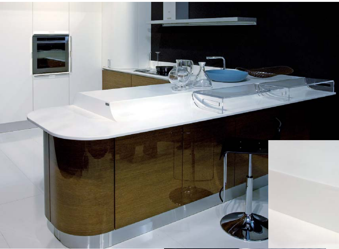
Îlot cuisine avec surélévation à congé pour plus de volume et d'espace.